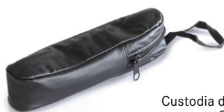
Custodia di fintapelle ORA-A2103