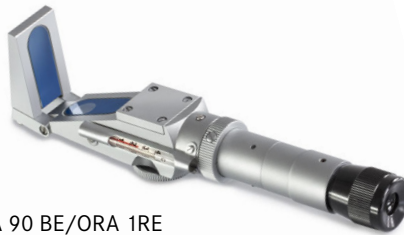
ORA 90 BE/ORA 1RE